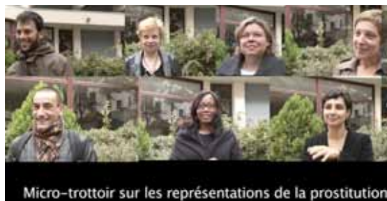
Table ronde Prostitution et société

Diffusion d'une vidéo micro trottoir sur ce que pensent de la prostitution des personnes travaillant dans le milieu social mais sans lien direct avec la prostitution.